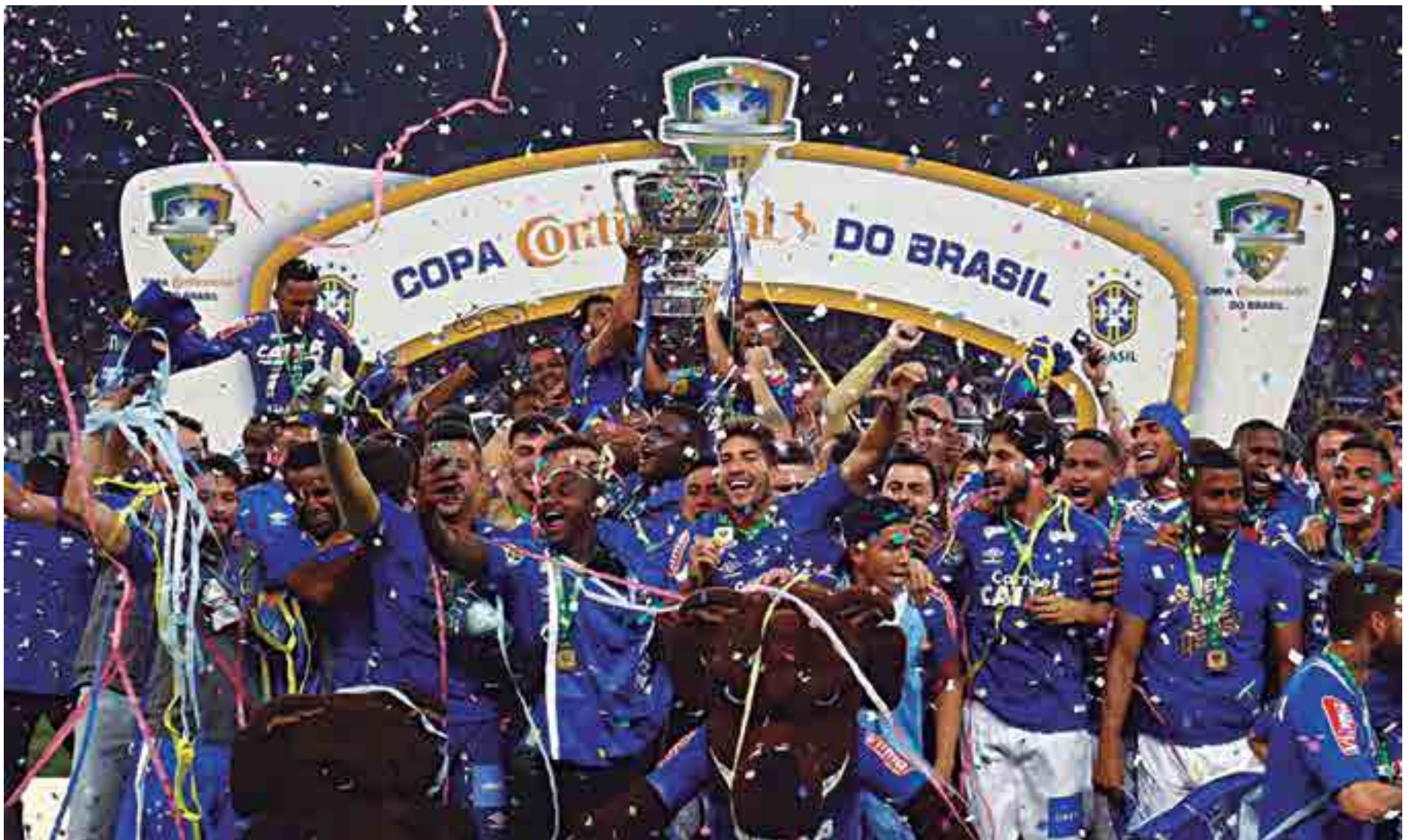
O Cruzeiro chegou a sua quinta conquista na Copa do Brasil e se igualou ao Grêmio, sendo o primeiro time brasileiro a confirmar vaga na Libertadores de 2018 com mais 14 outros clubes

Campeão da Copa do Brasil após vencer o Flamengo nos pênaltis, no Mineirão, o Cruzeiro é a primeira equipe brasileira garantida na Copa Libertadores de 2018. Será a 16ª participação da Raposa na história do torneio continental - ficou com o título em 1976 e 1997. O argentino Boca Juniors também já está garantido por ser o campeão do Campeonato da Primera División 2016-17, além de Racing, River Plate, Banfield e Estudiantes. The Strongest e Bolívar, ambos da Bolívia estão confirmados. Universidade do Chile e Atlético Nacional da Colômbia são mais dois participantes. Do Peru estão garantidos Melgar e Alianza de Lima; Libertad, do Paraguai; Delfin do Equador e Monagas, da Venezuela completam os 15 garantidos na Libertadores de 2018.