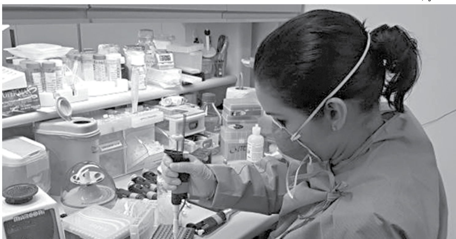
Cientistas compararam cepas do vírus da zika em épocas diferentes e detectaram mutação que possibilitou o desenvolvimento da microcefalia por infecção fetal em ratos

A análise evolutiva revelou que a mutação S139N provavelmente surgiu por volta de 2013, coincidindo com os relatórios iniciais de microcefalia e da síndrome de Guillain-Barré, associadas à zika. A zika, assim como dengue, a chikungunya e a febre amarela urbana são transmitidas pelo Aedes aegypti , um mosquito cuja população se multiplica com a chegada do verão, que lhe oferece condições propícias para a reprodução: temperaturas elevadas e focos de água limpa e parada devido às chuvas.