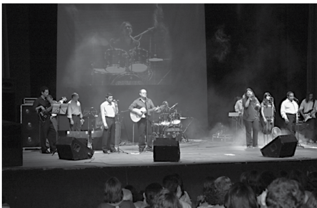
A banda "Acorde" tornou-se uma referência para o surgimento de novos grupos musicais espíritas

O Grupo Acorde surgiu em 1994 com a gravação do seu primeiro trabalho (fita K7 "Laços de Família"), lançado inicialmente no "II Seminário sobre o Pensamento Espírita" e, mais na frente, em 1995, no "I Congresso Internacional de Espiritismo", em Brasília/DF. Sem condições de custear as despesas do álbum nº 1, "Laços de Fa-