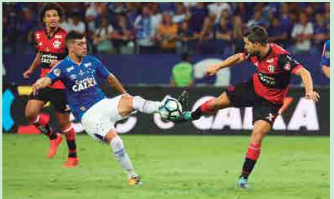
O Flamengo já foi eliminado da Libertadores, da Primeira Liga e agora perdeu a final da Copa do Brasil

Os principais reforços do Flamengo em 2017 chegaram ao clube somente no meio da temporada. Everton Ribeiro e o goleiro Diego Alves, por exemplo, sequer jogaram a Copa Libertadores e, por conta do regulamento, não puderam ser inscritos na Copa