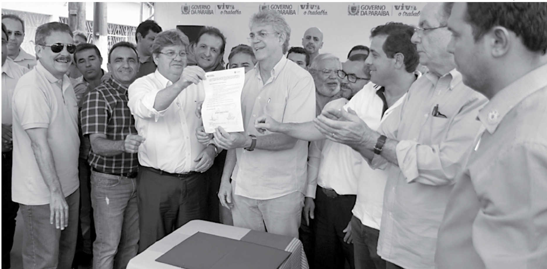
Além de segurança hídrica, a obra representa um investimento de R$ 20 milhões e foi comemorada pela população e por prefeitos, deputados estaduais e vereadores da região

bém lembrou que o Governo do Estado está construindo a TransParaíba, obra hídrica que vai levar água para todo o Curimataú. "É uma obra grandiosa que será o símbolo da mudança de vida para o povo daquela região que tanto necessita do abastecimento de água", pontuou.