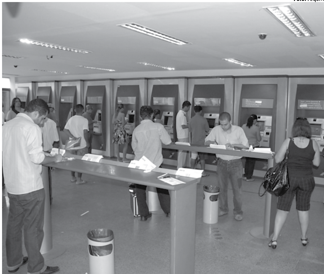
Saques das cotas do PIS com valor até R$ 1.500 poderão ser realizados em caixas automáticas da Caixa Econômica

Os saques de valores até R$ 3.000 podem ser feitos com Cartão do Cidadão e Senha Cidadão no Autoatendimento, Unidades Lotéricas e Caixa Aqui, com documento de identificação oficial com foto. Os valores acima de R$ 3.000