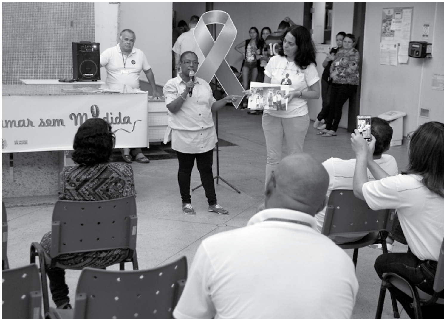
Peça teatral e depoimento de paciente marcaram as atividades de ontem da campanha; programação termina amanhã com uma "Caminhada pela Vida", em Tambaú

"A campanha tem o objetivo de sensibilizar a população e, conseqüentemente, aumentar o número de transplantes. É importante que as pessoas se conscientizem desse gesto de solidariedade. Hoje você é convocado para doar, mas em algum momento você também pode precisar dessa doação. Então, a gente pede que reflitam sobre isso, se coloquem no lugar de quem está precisando de uma doação de órgãos, avisem sobre sua vontade,