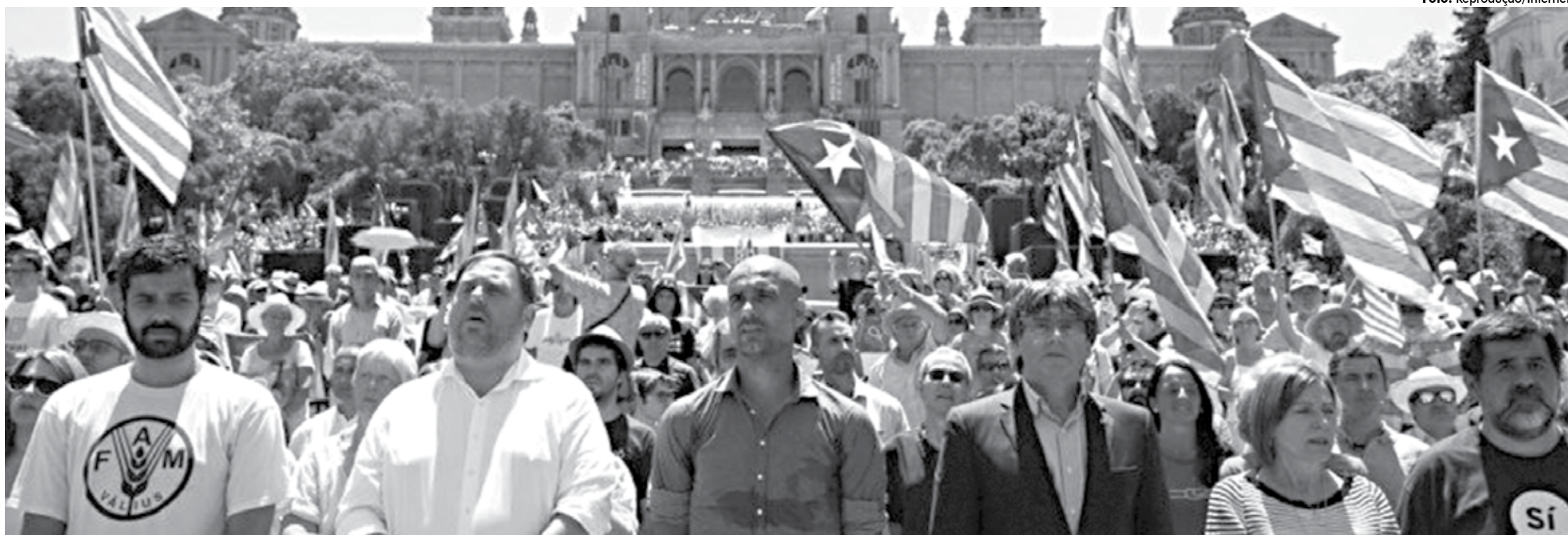
A Catalunha trava uma luta ferrenha com repercussão mundial para conseguir sua independência, mas vem encontrando forte resistência do governo da Espanha, que usa argumentos constitucionais para evitar separação